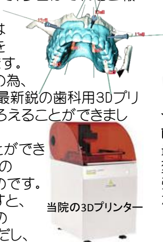
当院の3Dプリンター

当院ではCT、スキャナー、インプラント設計ソフト、3Dプリンターをすべてグループ内で所有しているため、この手術用のガイドの納期が従来3週間ほどかかっていたものが、なんとたった1日で出来てしまうんです。実際に遠方からいらして翌日に手術を行って帰られた患者様もおられます。この画期的なシステムを院内で完結できるのは日本広しと言えども現在は当院のみにしかできない治療オプションなのです。